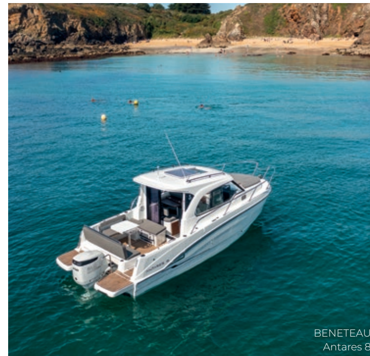
BENETEAU Antares 8