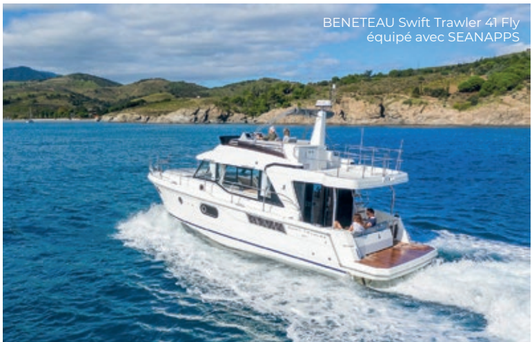
BENETEAU Swift Trawler 41 Fly équipé avec SEANAPPS

Chaque client peut ainsi bénéficier de l'historique complet de ses navigations avec les détails de performances, de la géolocalisation du bateau en temps réel avec une alerte de position, de l'état des systèmes en temps réel grâce aux 35 capteurs présents à bord du bateau et à la version digitale du manuel du propriétaire directement sur l'application.