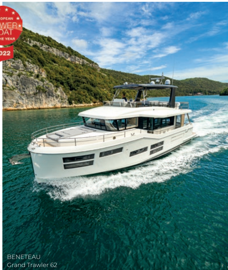
BENETEAU Grand Trawler 62