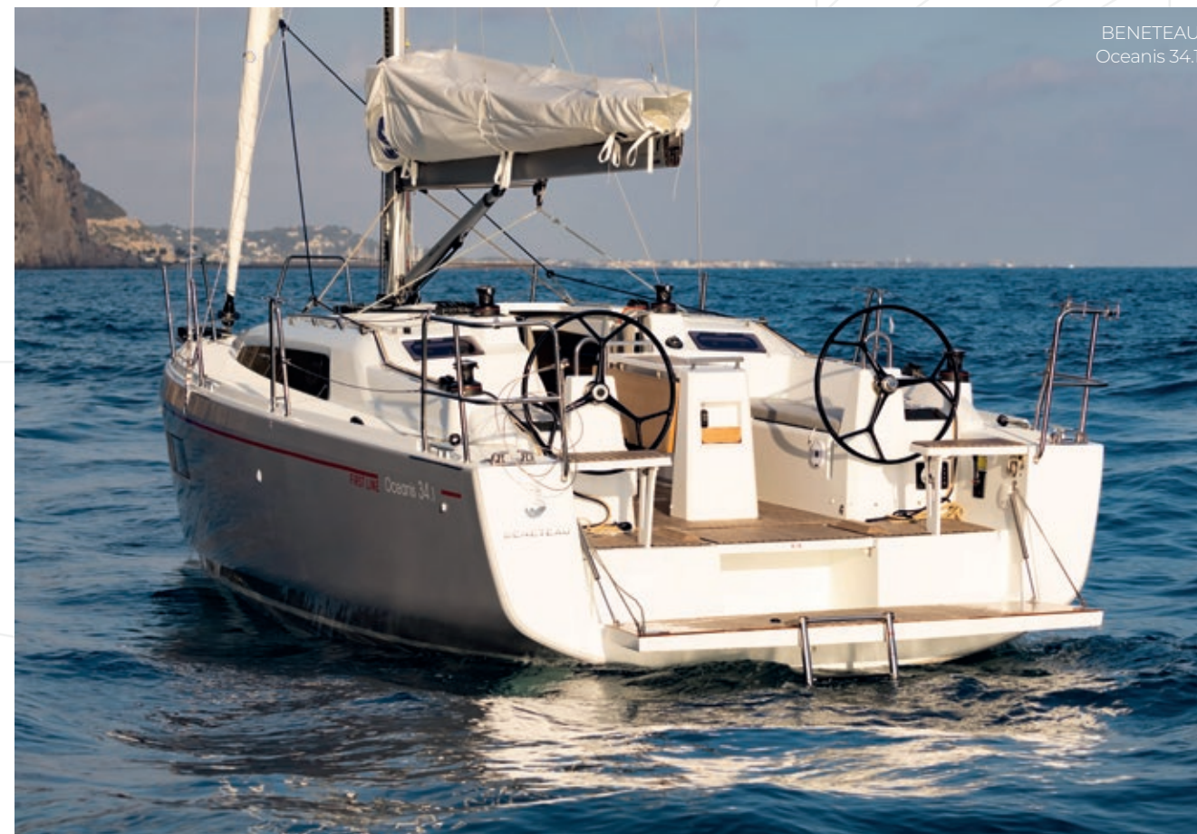
BENETEAU Oceanis 34.1

Avec moins de 10 mètres et un prix compétitif, BENETEAU a réussi son pari! Plus élancé, plus léger, plus toilé et plus spacieux à l'avant que son prédécesseur, le BENETEAU Oceanis 34.1 se destine à la croisière tout confort et lui fait donc la part belle grâce à l'ergonomie et à la fluidité de circulation à bord.