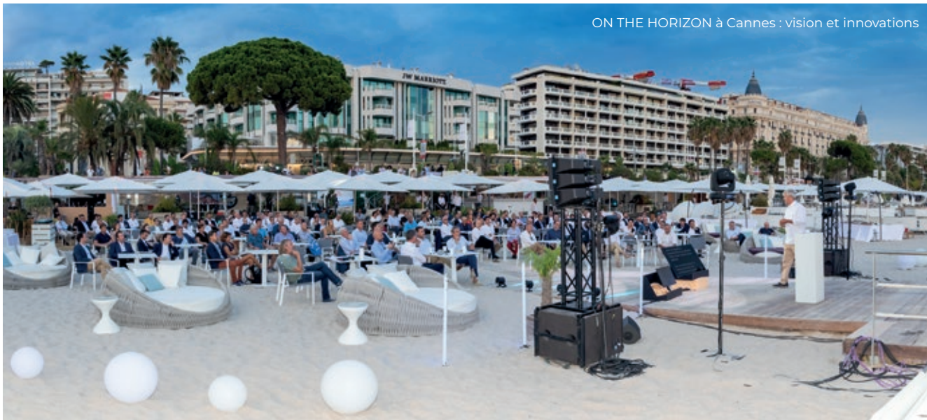
ON THE HORIZON à Cannes : vision et innovations