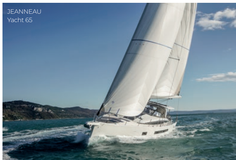
JEANNEAU Yacht 65

Proposant un large choix de personnalisation sur le pont et à l'intérieur, le JEANNEAU Yacht 65 s'adapte aux rêves de son propriétaire et reste en contact avec lui grâce à la solution SEANAPPS embarquée de série. Doté d'une large autonomie pour voyager loin, il offre un confort unique au mouillage.