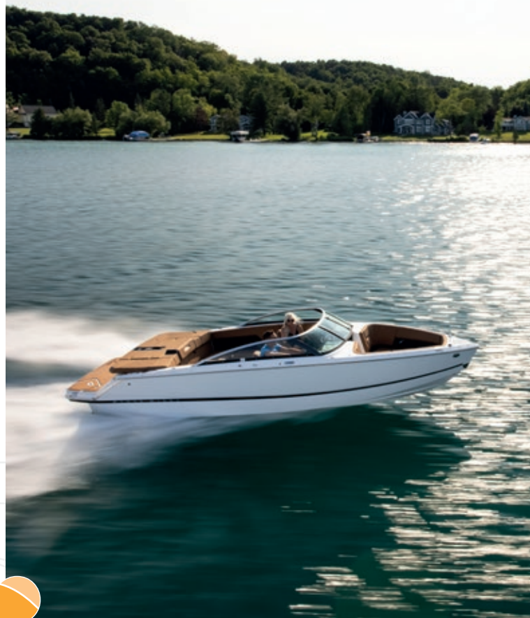
FOUR WINNS H4

— PROPRIÉTAIRE JEANNEAU CAP CAMARAT 7.5 BOW RIDER