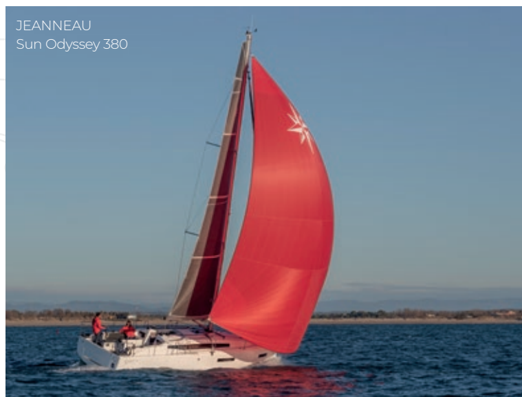
JEANNEAU Sun Odyssey 380