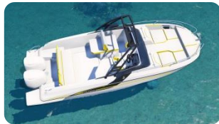
Flyer 7 SPORTdeck

Les deux nouveaux Flyer 7 SUNdeck et SPORTdeck , présentés au Nautic de Paris, constituent une nouvelle étape dans le développement de la dernière génération de hors-bords conçue par Bénéteau. Racés, spacieux, ces deux nouveaux day-boat proposent des aménagements inédits sur une carène AirStep qui a fait ses preuves de performance et de sécurité. Élégant dessin aérodynamique, large étrave, montants latéraux profilés : les Flyer 7 SUNdeck et SPORTdeck sont empreints du même style très personnel qui fait le succès des Flyer 6 et 5, lancés il y a quelques mois. Propulsés en mono ou bi-motorisation, ces deux Flyer d’un peu plus de 7 mètres apportent au pilote et à son équipage autant de sensations que d’aisance en manœuvres.