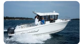
MERRY FISHER 695

Merry Fisher : plus de design et toujours plus de confort . Dans cette gamme de bateaux familiaux et économiques, deux nouveautés sont lancées cette année : le Merry Fisher 695 qui offre un nouveau design et une nouvelle carène très performante et le tout nouveau Merry Fisher 605 , un bateau au design élané. Idéal pour découvrir les joies de la navigation, il sera lancé au salon de nautique de Paris.