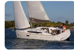
SUN ODYSSEY 349