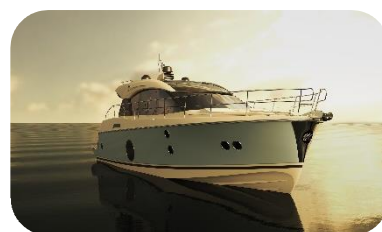
NEW MONTE CARLO 5 S