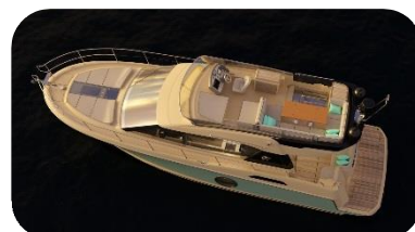
NEW MONTE CARLO 4