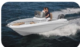
CAP CAMARAT 4.7 CC

En moteur : le LEADER 38 , exposé en première mondiale à Cannes , se montre performant et actuel, et bénéficie de la meilleure influence du design contemporain pour une grande harmonie à bord.