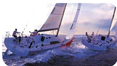
SUN FAST 3600