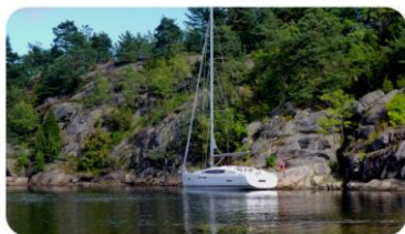
Sun Odyssey 41 DS