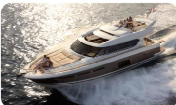
Prestige 620 S