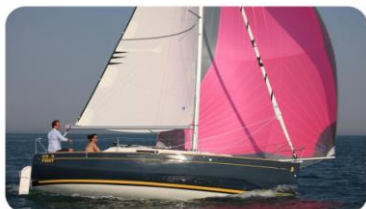
First 25 S