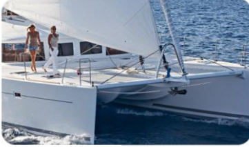
Lagoon 560