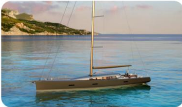
CNB 100 Evoë