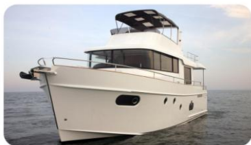
Swift Trawler 50