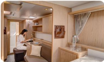
Lagoon 400 S2